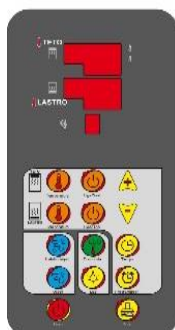
INV 125-19-01 Teto Lastro

FORNOS PNOVA ELETRICO SÃO INDICADOS PARA PADARIAS, CONFEITARIAS E SALGATERIAS